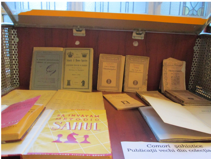
Comori șahistice Publicații vechi din colecția